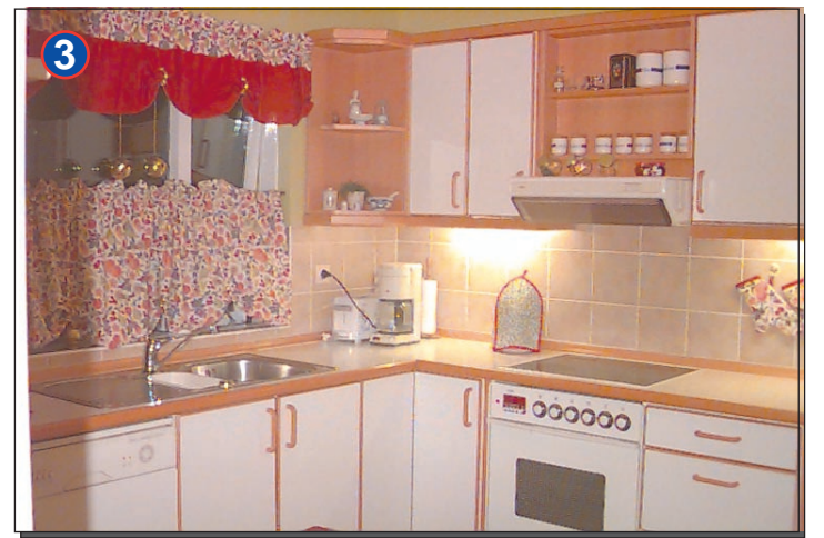
Nýuppgerð eldhús með stórri og góðri innréttingu