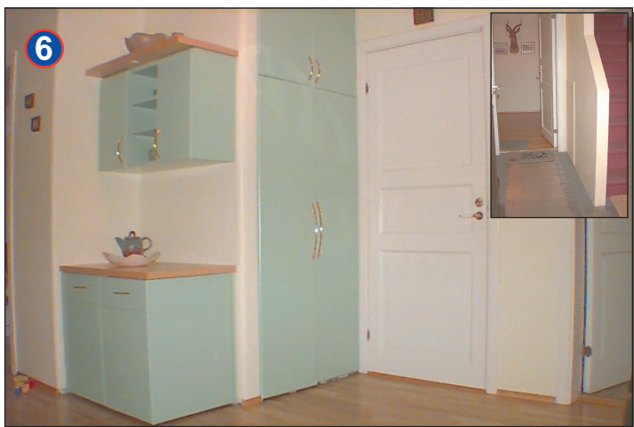
Rúmgóður gangur með nýjum fataskáp