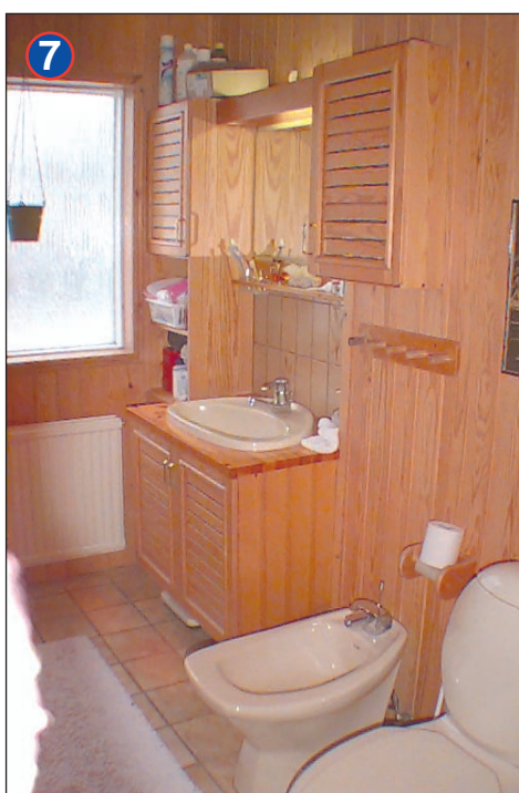
Klósett m. baði, sturtu og góðu plássi fyrir þvottavél og þurrkara.