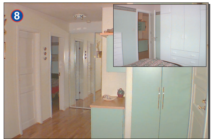
Rúmgóður gangur með nýjum fataskáp