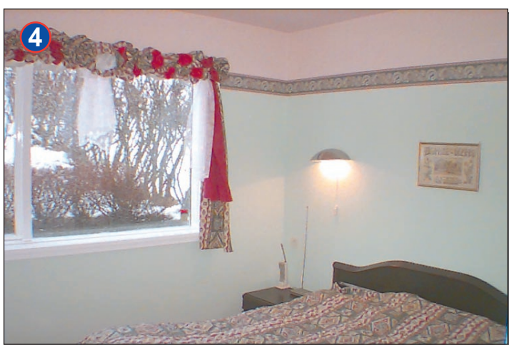
Hjónaherbergi með nýjum vönduðum rúmgóðum fataskápum.