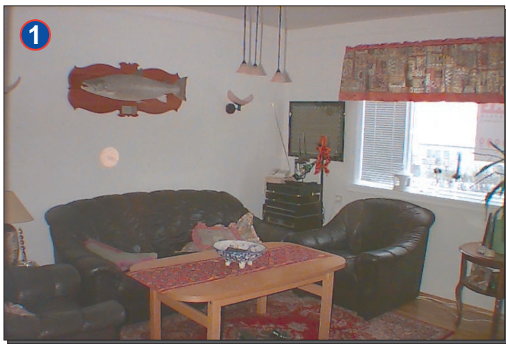
Stofa með góðu útsýni að Esjunn