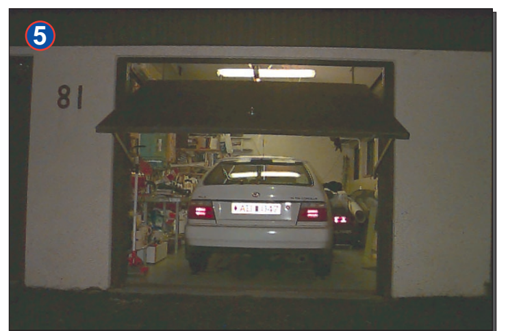
Nýbyggður stór bílskúr með gryfju, loftræstikerfi, heitt og kalt vatn, símalögn..og stórum geymslu kjallara. Rúmir 60 fermetrar að gólfleti.